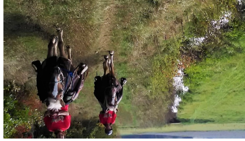
WANDERREITEN RUND UMS RIES_Am Sternbach