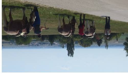
WANDERREITEN RUND UMS RIES_Pause Sallmannsberg