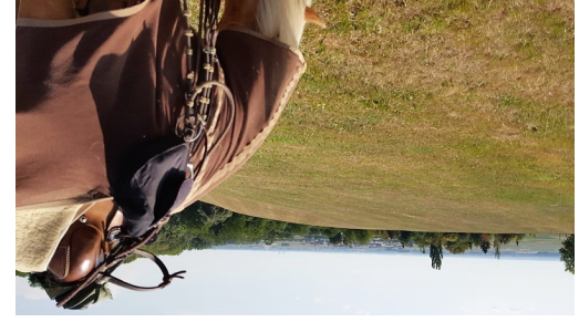
WANDERREITEN RUND UMS RIES_Panorama Sallmannsberg