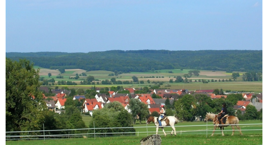
WANDERREITEN RUND UMS RIES_Goldbergpanorama

WanderReitbetrieb Hof Kranichau in Leiheim