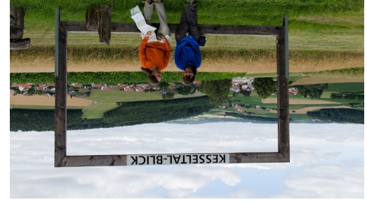
WANDERREITEN RUND UMS RIES_Kesselal Panorama